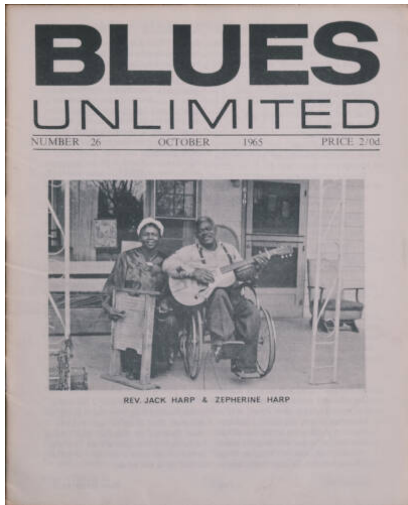
BLUES Unlimited [alt. 1] Cote CEMjazz: cat-rv-50