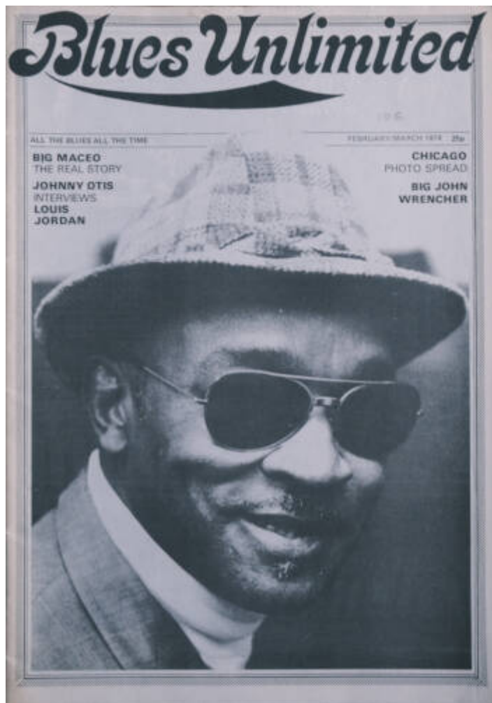
BLUES Unlimited [alt. 2] Cote CEMjazz: cat-rv-50